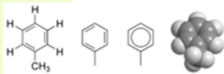
Obrázek 1: Struktura molekuly toluenu (různé typy vzorců)

Toluén je čirá bezbarvá kapalina s aromatickým zápachem. Teplota tání činí -93^{\circ}\text{C} a varu 111^{\circ}\text{C} . Jeho hustota je 867 \text{ kg}\cdot\text{m}^{-3} a rozpustnost ve vodě 530 \text{ mg}\cdot\text{l}^{-1} . Při pokojové teplotě je těkavý a hořlavý. Může se rozpouštět v tucích a dobře se rozpouští v organických rozpouštědlech. Přirozeně se vyskytuje v ropě. Benzín obsahuje 5 – 7 % toluenu. Toluén patří mezi těkavé organické látky (VOC). Struktura molekuly je znázorněna na obrázku 1.